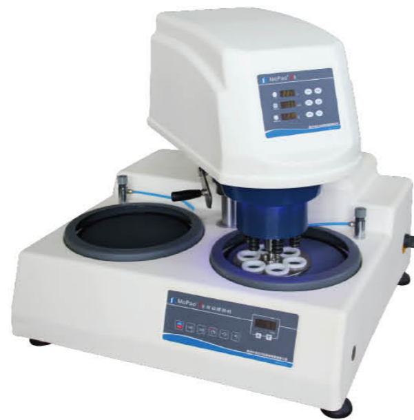
▲ MoPao® 3S型自动磨抛机