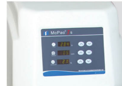
▲ 参数设置方便易用

本系列机型适用于对金相试样的粗磨、精磨、粗抛光至精抛光过程进行自动制样，是企业、科研单位以及大专院校实验室的理想制样设备。