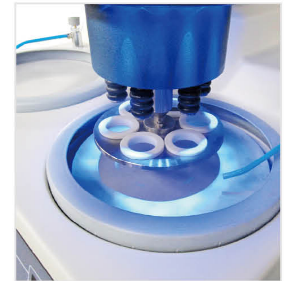
▲ LED工作照明灯 单点加压 可夹持1-6个试样